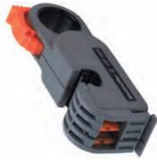
CST vario Decapar cabos coaxiais \varnothing de 2,5...8 mm. Compr. até 17 mm.